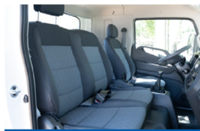
Cabina amplia y confortable