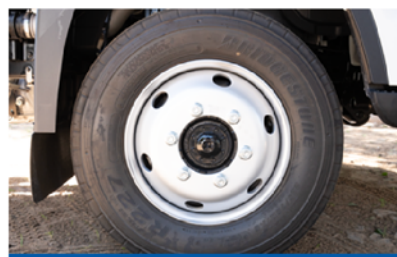
Cubiertas 205/75 R 17.5-12PR Bridgestone